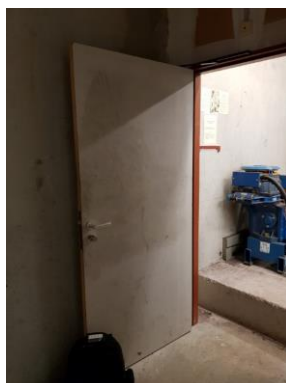
Accès machinerie 2