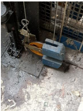
Poulie tendeuse cabine