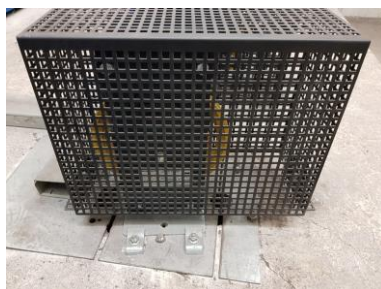
Limiteur de vitesse cabine