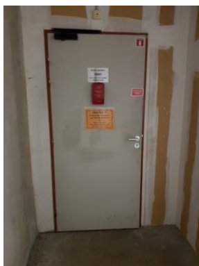
Accès machinerie 1