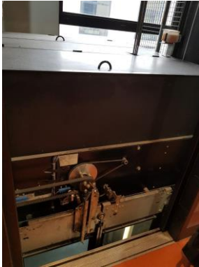
Opérateur de porte cabine (Face 1)