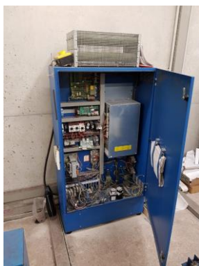
Armoire de manoeuvre